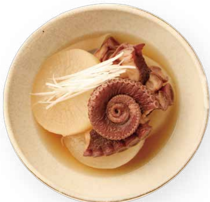
大根とミズダコの煮物

ミズダコ(ゆで)250gはみじん切り(または少量の水とともにミキサーで細かく攪拌)する。フライパンでオリーブオイル大さじ1.5、ニンニクのみじん切り1片分、唐辛子1本を香りが立つまで熱し、タコを加える。水分が出て火が通ったら、トマト水煮1缶(400g)、ローリエ1枚を加えて煮て、塩、こしょう各適量、砂糖約小さじ1で調味する。鍋底にヘラの筋が残る程度に煮詰め、ゆでたパスタに絡め、好みでオリーブオイルを回しかけてパセリを散らす。