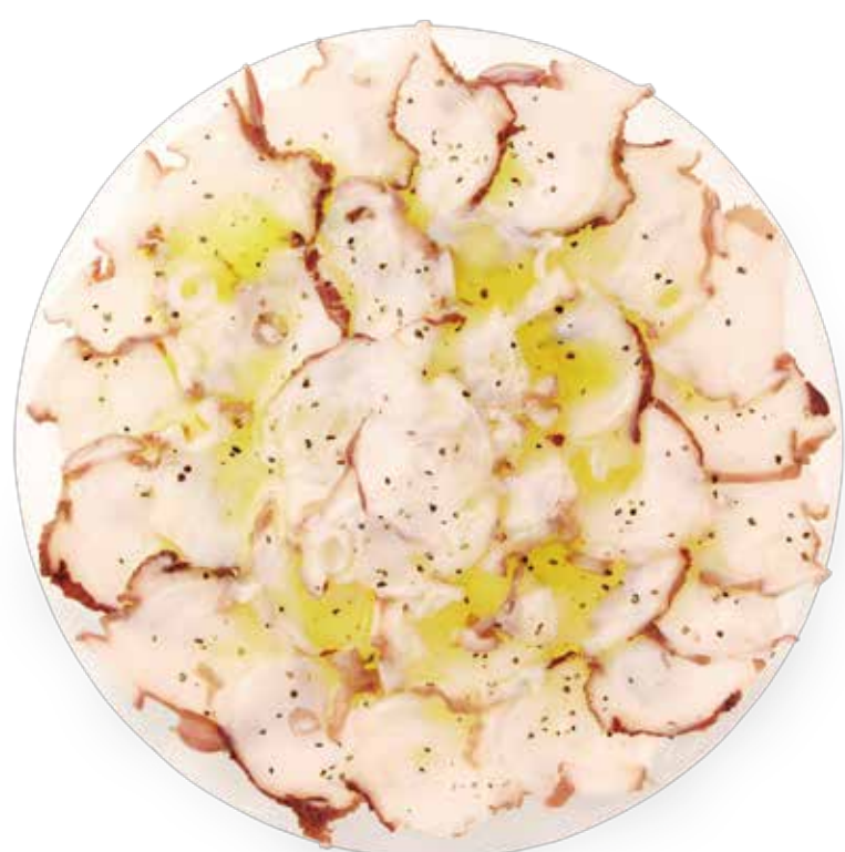
ミズダコのカルパッチョ

大根1/2本は皮をむいて大きめに切り、米のとぎ汁で下ゆでする(大根が白く仕上がる)。ゆで汁を捨て、食べやすい大きさに切ったミズダコ(ゆで)250g分、かぶるくらいの出汁を加えて中火にかける。酒、みりん、砂糖各大さじ3、醤油大さじ2を順に加えながら弱火でゆっくり煮る。汁が煮詰まってきたら器に盛り、白髪ネギをのせる。