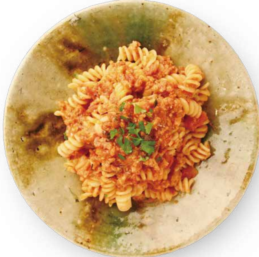
ミズダコのラグーパスタ

ミズダコ(ゆで)250gはみじん切り(または少量の水とともにミキサーで細かく攪拌)する。フライパンでオリーブオイル大さじ1.5、ニンニクのみじん切り1片分、唐辛子1本を香りが立つまで熱し、タコを加える。水分が出て火が通ったら、トマト水煮1缶(400g)、ローリエ1枚を加えて煮て、塩、こしょう各適量、砂糖約小さじ1で調味する。鍋底にヘラの筋が残る程度に煮詰め、ゆでたパスタに絡め、好みでオリーブオイルを回しかけてパセリを散らす。