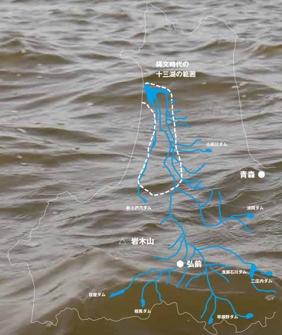
【青森県五所川原市十三湖】