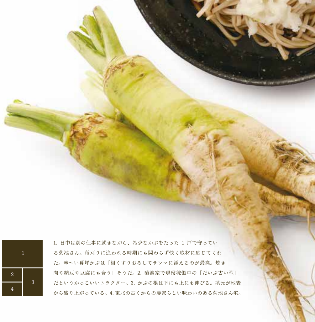
1. 日中は別の仕事に就きながら、希少なかぶをたった1戸で守っている菊池さん。種列りに追われる時期にも関わらず快く取材に応じてくれた。辛〜い暮坪かぶは「粗くすりおろしてサンマに添えるのが最高。焼き肉や納豆や豆腐にも合う」そうだ。菊池家で現役稼働中の「だいぶ古い型」だというカッコいいトラクター。3. かぶの根は下にも上にも伸びる。茎元が地表から盛り上がっている。4. 東北の古くからの農家らしい味わいのある菊池さん宅。