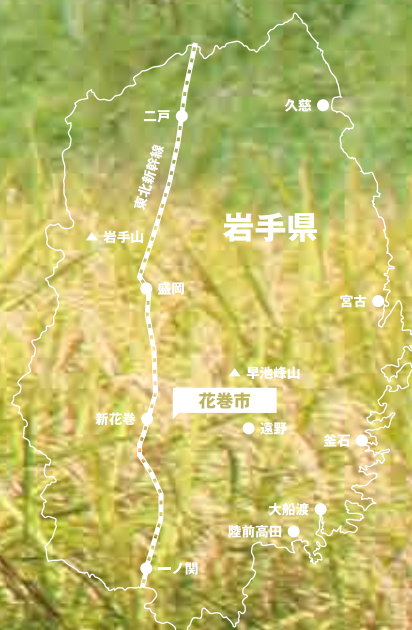
【岩手県花巻市東和町】